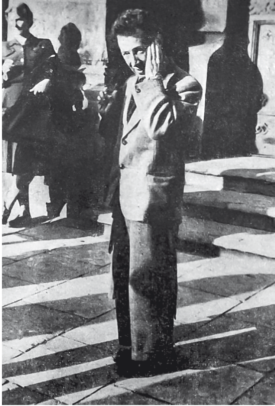
Fot. 8. Walter Heitler

Warto zwrócić uwagę na kolejnego uczestnika konferencji: to Walter Heitler (1904–1981), fizyk teoretyk, uczeń Arnolda Sommerfelda, który w Krakowie wygłosił referat O produkcji składowych promieniowania kosmicznego . Heitler jest autorem prac dotyczących wiązań chemicznych, zajmował się również oddziaływaniami elektromagnetycznymi i teorią wielkich kaskad promieniowania kosmicznego, a jego książka Quantum Theory of Radiation , wydana w 1936 r., została przetłumaczona na kilka języków 19 .