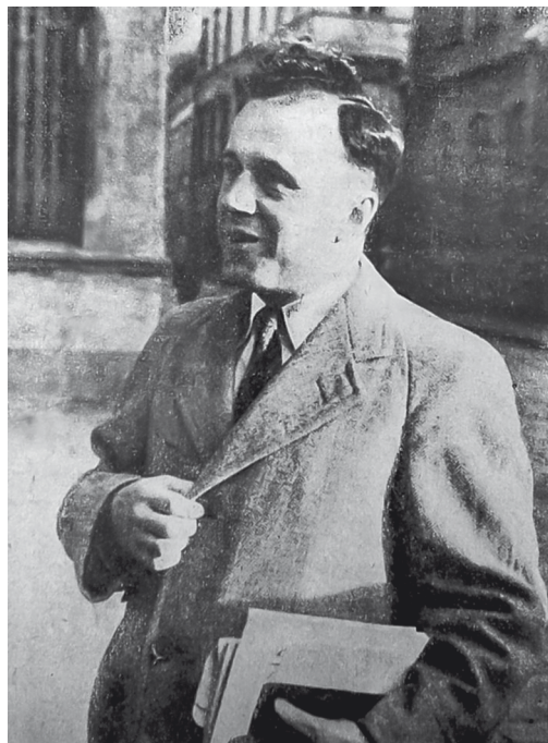
Fot. 9. Profesor J.A. Wheeler z Princeton (USA)