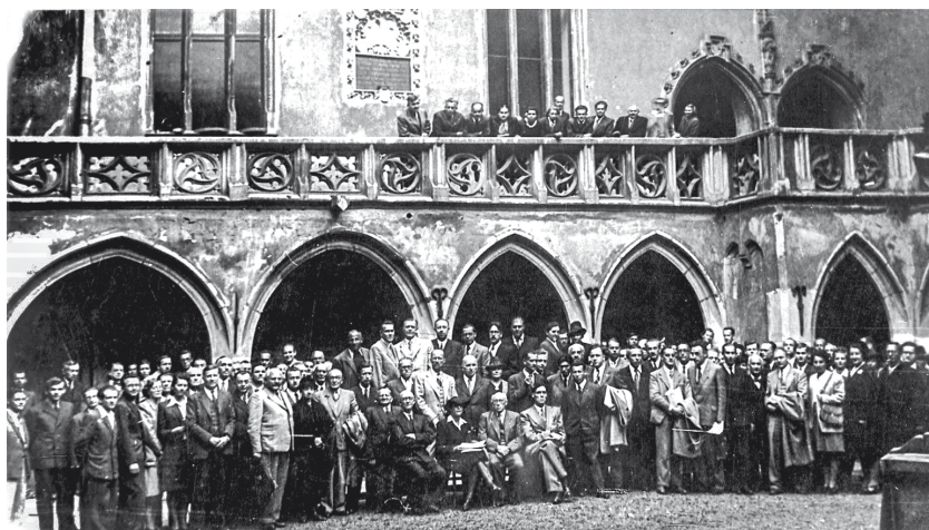
Fot. 1. Uczestnicy Międzynarodowej Konferencji Promieni Kosmicznych w Krakowie, październik 1947 3

wydarzeniem w powojennych dziejach krakowskiej fizyki było zorganizowanie w październiku 1947 r. I Międzynarodowej Konferencji Promieni Kosmicznych 2 .