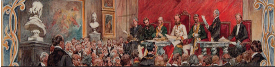
Pierwsze walne posiedzenie publiczne Akademii Umiejętności w dniu 7 maja 1873. Fragment akwareli Juliusza Kossaka.

Karol Ludwik. Z tego powodu posiedzenie inauguracyjne mogło zostać wyznaczone dopiero na 7 maja, kiedy arcyksięcia nic pilniejszego nie zatrzymywało w Wiedniu.